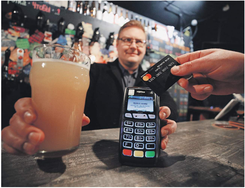
Дмитрий Коротаев / «Известия»