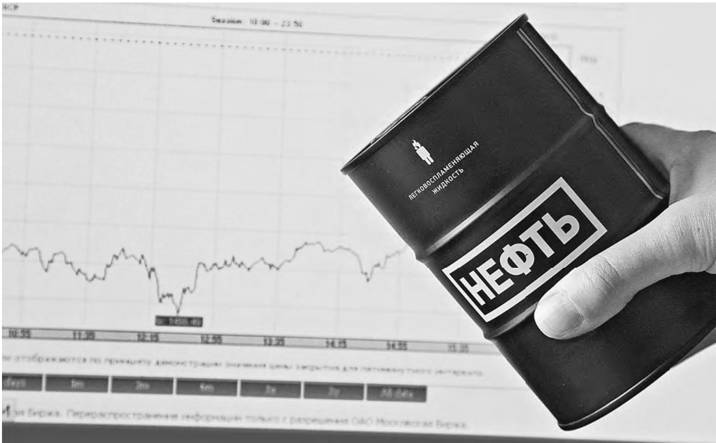
Какой будет цена бочки нефти, сегодня во многом зависит от стран Персидского залива.