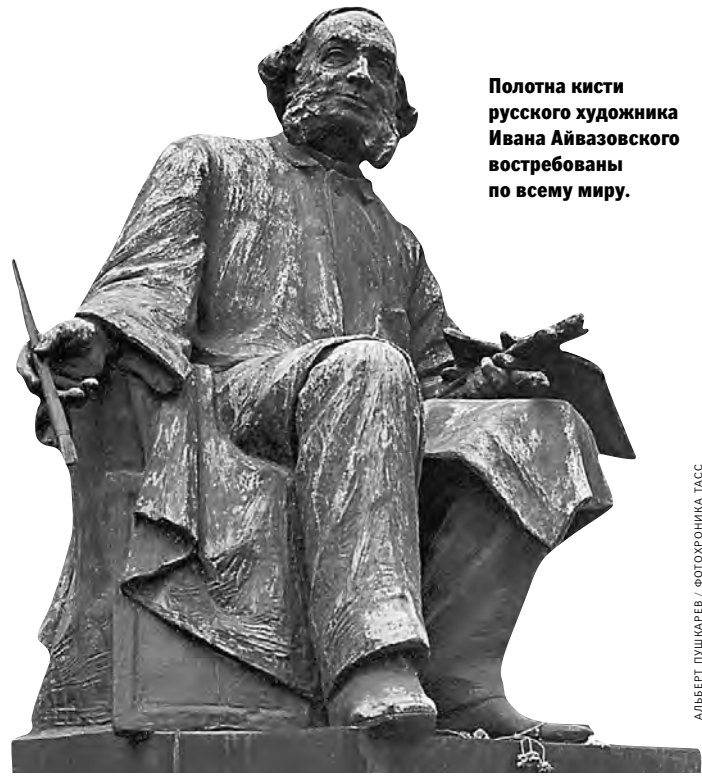
Полотно кисти русского художника Ивана Айвазовского востребованы по всему миру.

Сегодняшние русские торги Sotheby's в Лондоне оказались сенсационными еще до первого удара молотка, возвещающего продажу. Причиной стало полотно Айвазовского «Вечер в Каире» (1870), о котором некоторое время назад разгорелся спор между... нынешними собственниками и семьей из России, которая заявила о том, что похожая картина была украдена в Москве в 1997 году. У этой картины Айвазовского судьба сложилась также нелегко, как и у ее прежних хозяев. Где-то в 1940-х, уже после войны, контр-адмирал Иван Носенко, немало сделавший для становления советского военного и гражданского флота, купил ее у известного коллекционера Деда. Носенко занимал в 1954–1956 годах исключительно от-