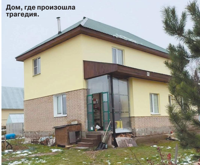
Дом, где произошла трагедия.