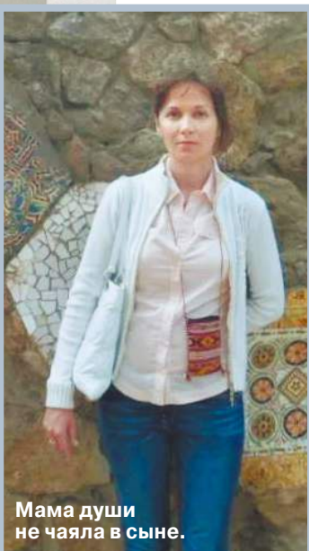
Мама души не чаяла в сыне.

Кошмарная трагедия в тихом поселке на краю Московской области — 15-летний подросток жестоко убил свою маму. Женщина воспитывала мальчика одна, души в нем не чаяла, а «провинилась» лишь тем, что запрещала школьнику с утра до вечера рубиться в компьютерные игры.