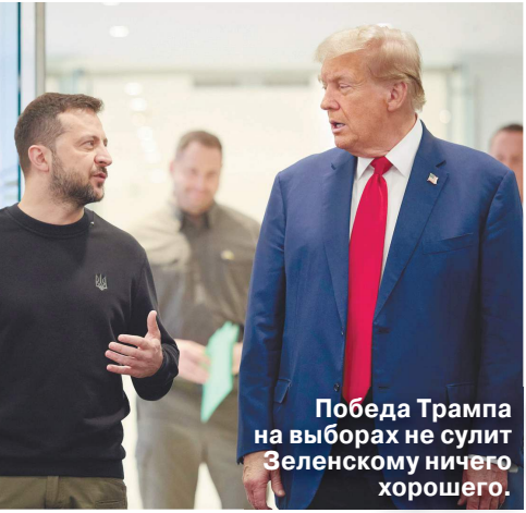
Победа Трампа на выборах не сулит Зеленскому ничего хорошего.

Почему «план Трампа» по Украине невыгоден России