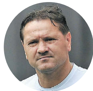
СПЕЦИАЛЬНО ДЛЯ «СЭ»

Самый титулованный футболист страны, победитель Лиги чемпионов и Лиги Европы в составе «Порту», бывший главный тренер «Спартака» в своей авторской колонке для «СЭ» подводит итог октябрьских матчей сборной России