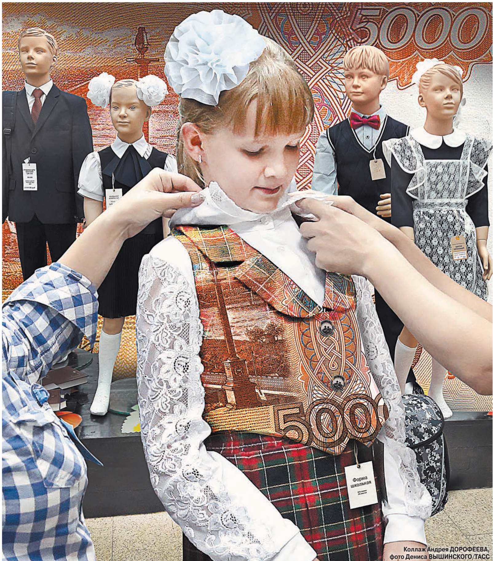
Коллаж Андрея ДОРОФЕЕВА, фото Дениса ВЫШИНСКОГО/ТАСС