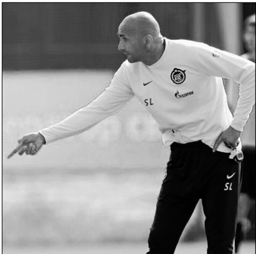
Вчера. Санкт-Петербург. Лучано СПАЛЛЕТТИ.