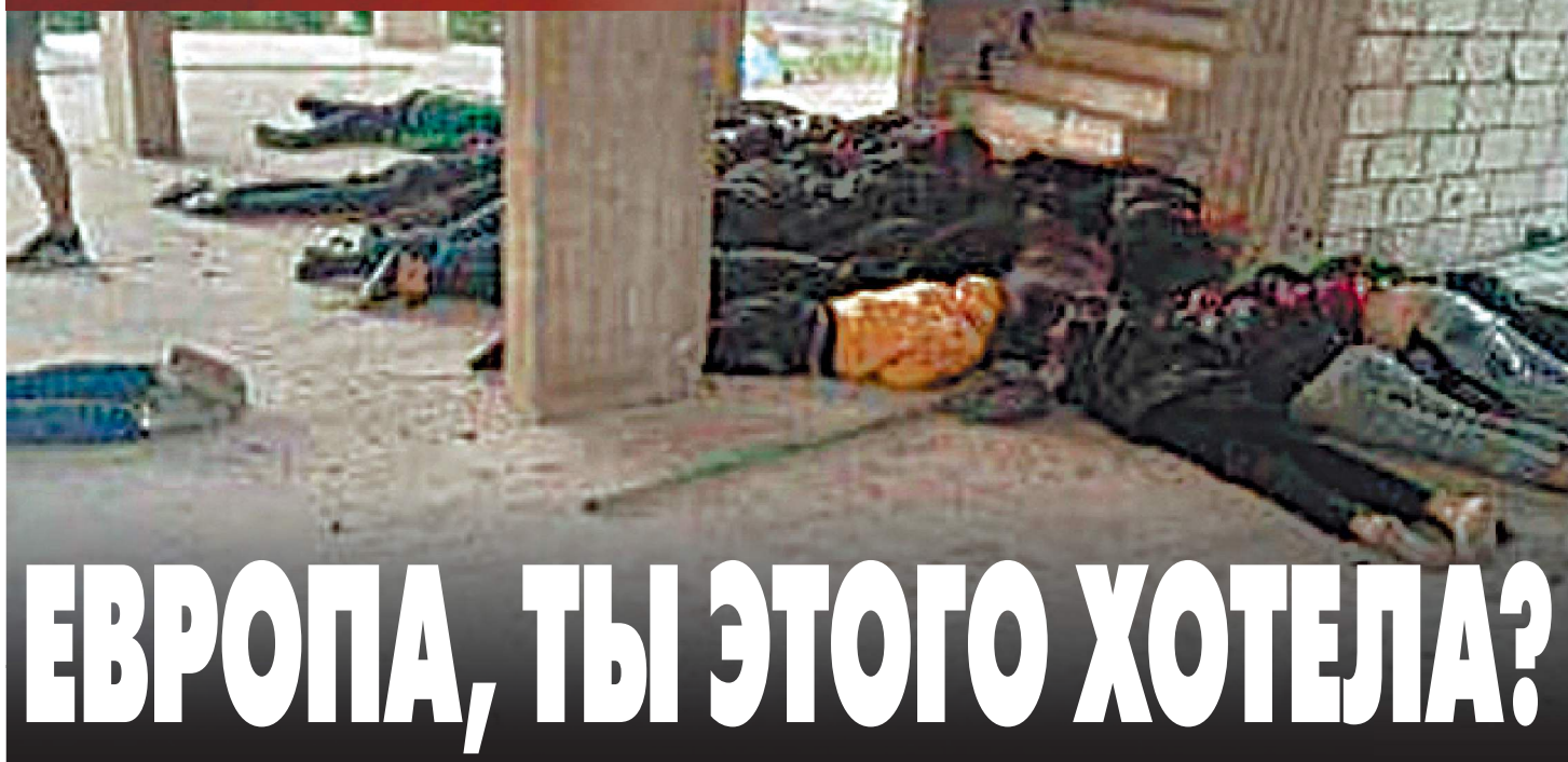
Свободы и равноправия эти сирийцы, ставшие жертвами кровавой резни, уже никогда не дождутся.