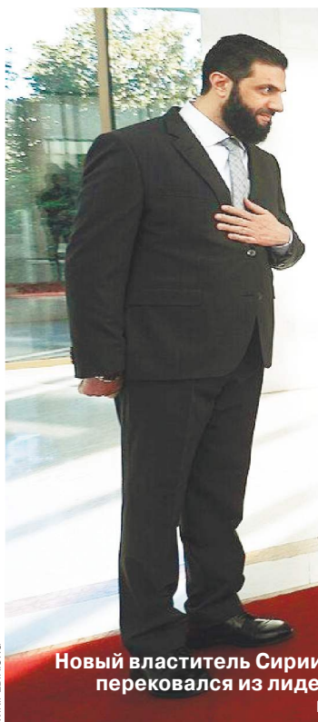
Новый властитель Сирии Ахмед аш-Шараа перековался из лидеров экстремистов в «рукопожатные».