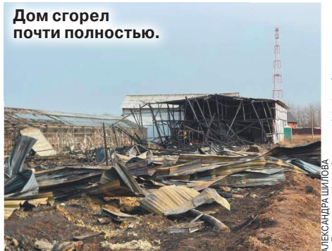
Дом сгорел почти полностью.

вертолете отправили в охотничий центр. В тридцати метрах от сгоревшей хозяйственной постройки находилось тепличное хозяйство. В 10 теплицах, находящихся друг от друга в 5 метрах, выращивали овощи: огурцы и помидоры. Теплицы от огня пострадали частично — так, в ближайшей к дому попала одна.