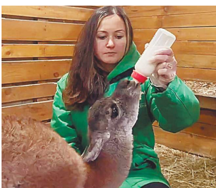
Смесь, адаптированную к потребностям новорожденных лам.

+5...+10°. В четверг понижение температуры продолжится. Холодный фронт принесет скоротечные льдины, к дождю кое-где может примешиваться мокрый снег, из-за чего ночью поспеет до 0...+5°, днем до +3...+8°. В пятницу днем небольшой дождь, и потеплеет до +6...+11°. В выходные ожидаются традиционные мартовские возвраты холодов: в субботу фронт принесет ливневые осадки в смешанном состоянии; ночью 0...+5°, днем не выше +1...+6°. В воскресенье инициатива перекартит гребень антициклона, благодаря чему распогодится; в середине ночи легкие заморозки, днем +2...+7°.