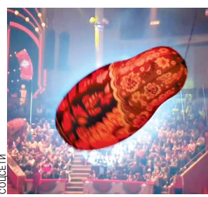
Посетительница Московского цирка Никулина на Цветном бульваре получила травму головы во время представления вечером 9 марта.

Как стало известно «МК», инцидент произошел в конце второго действия спектакля «Матрешка», около 20.30. На цирковой арене