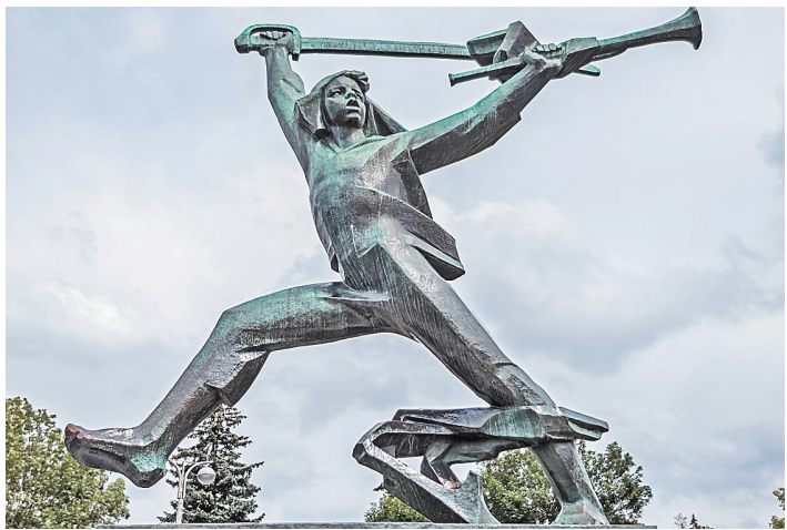
Памятник Мальчишу появился на территории Дворца пионеров на Воробьевых горах 19 мая 1972 года.

просто грезить можно было и в таганской коммуналке, где на 43 человека был один умывальник (как, например, будущая прима театра и кино Наталья Гундарева), и в шпанских подвортных Арбата (как актеры Роман Быков и Игорь Кваша), и в элитном Доме правительства с видом на Кремль на улице Серафимовича (как писатель Юрий Трифонов)... Мечтать в довоенной Москве можно было где угодно. Но воплотиться мечта могла только во Дворце. Во Дворце пионеров. «Зима 1937—38 годов была тревожной, трудной. До сих пор помню... ощущение праздничного, знобщего волнения... Почти бежал переулком к старинному дому, все окна которого были освещены... теплый, праздничный дом. ...Споры, обсуждения, взаимная разрушительная критика, интересные лекции — все это пришло потом. Они дали мне что-то очень важное, без чего я не стал бы писателем», — писал о литературной студии Дома пионеров автор романа «Дом на набережной» Юрий Трифонов. В литературно-творческой студии на Стопани выросли писатели Юрий Трифонов, Сергей Баруздин, Анатолий Алексин, Сергей Львов... Жизнь здесь пусть на чуть-чуть, но опережала реальность, в которой существовали дети.