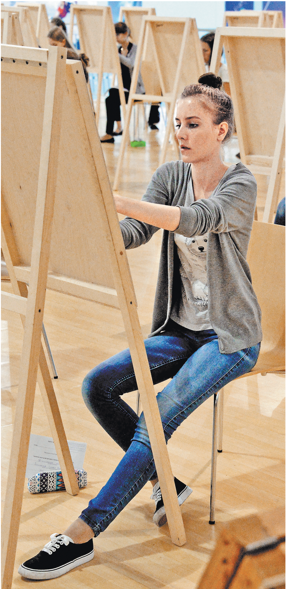
Уникальность совместных пленэров, мастер-классов в том, что ученик и педагог работают вместе. Рукou ученика «водит» мысль педагога.