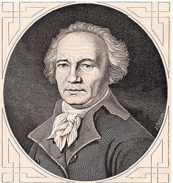
Андрей Тимофеевич Болотов называл фигурой, едва ли не равной Ломоносову.