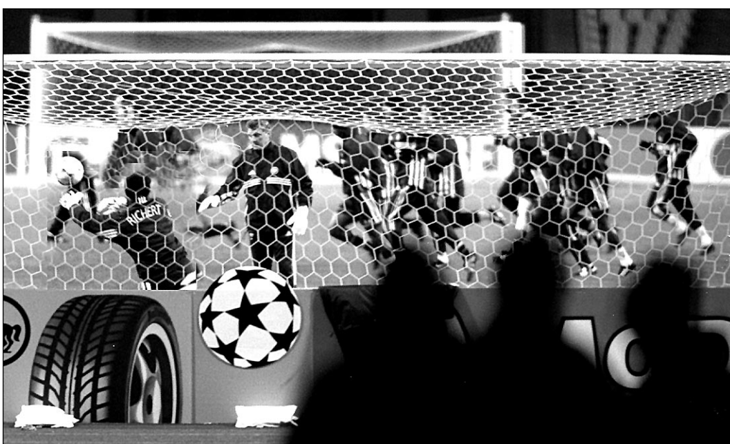
Этот снимок вчерашней тренировки «Бордо» в Лужниках фотокорреспондент «СЭ» сделал тайно из-за спин охранников.