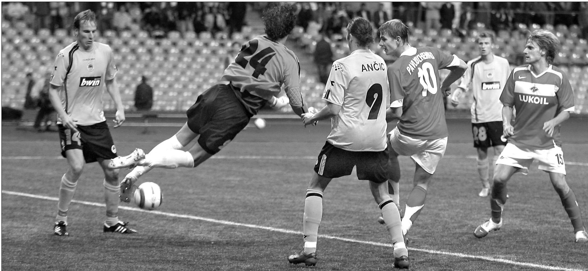
Вчера. Москва. Лужники. «Спартак» - «Слован» - 2:1.