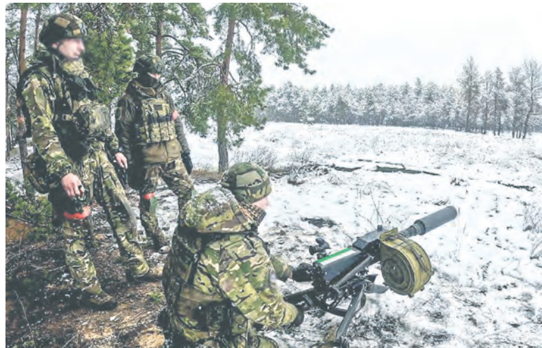
Станковый гранатомёт врагу пощады не даёт.