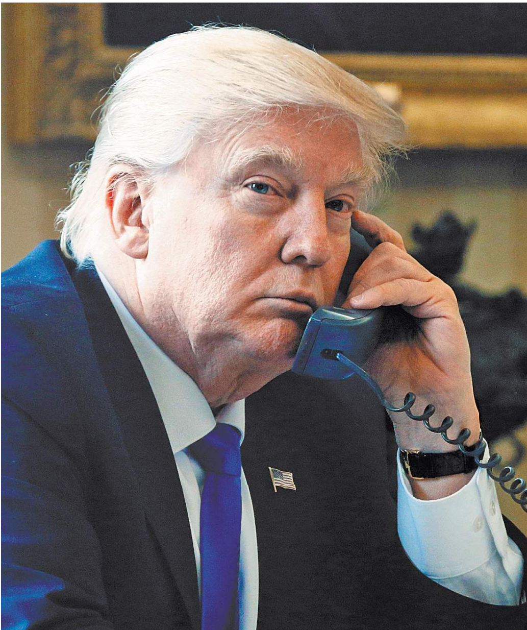
Дональд Трамп: Владимир, ты можешь в любой момент поднять трубку и я с удовольствием с тобой переговорю.

Путин. Президент РФ рассказал, что договорился с президентом США о том, что «Россия предложит и готова работать с украинской стороной над меморандумом по поводу возможного будущего мирного договора с определением ряда позиций». «Таких как, например, принципы урегулирования, сроки возможного заключения мирного соглашения и так далее, включая и возможное прекращение огня на определен-