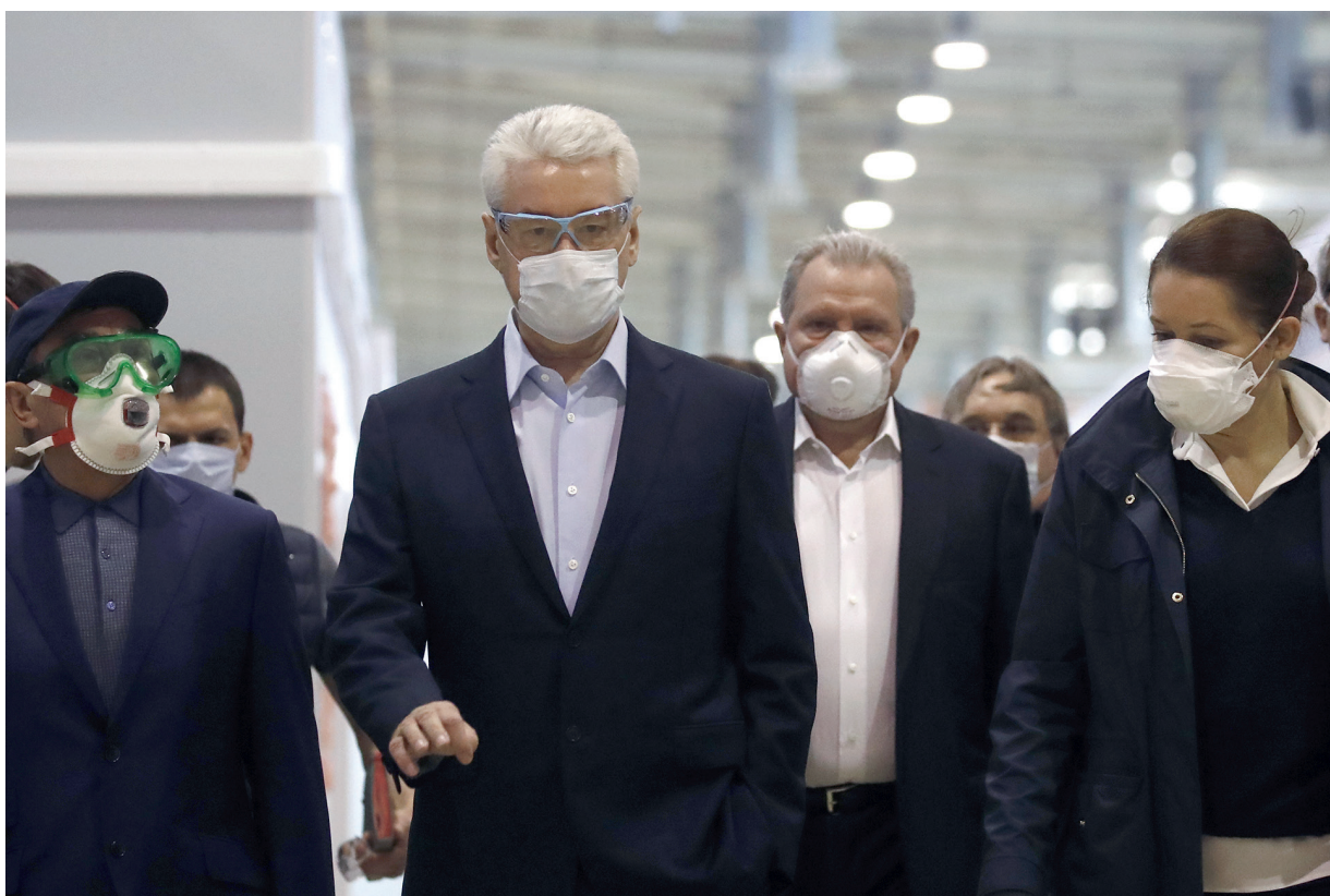
Москва примеряет на себя роль полигона для отработки выхода из коронавирусного кризиса.

Агентство стратегических инициатив прогнозирует достижение пика по уровню безработицы в России в I квартале 2021 года. Без работы к этому моменту, по его оценке, могут остаться 8,5–10 млн человек.