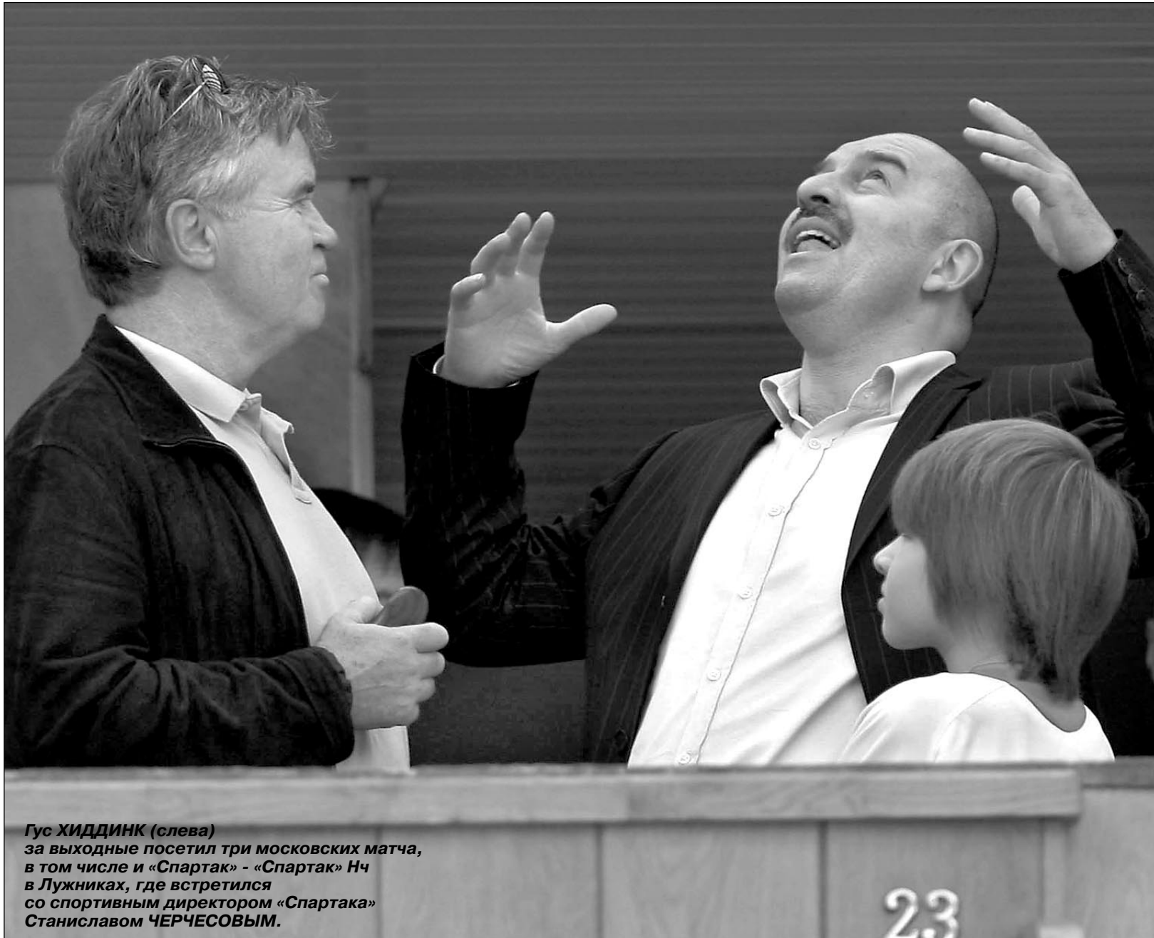
Гус ХИДДИНК (слева) за выходные посетил три московских матча, в том числе и «Спартак» - «Спартак» НЧ в Лужниках, где встретился со спортивным директором «Спартан» Станиславом ЧЕРЧЕСОВЫМ.