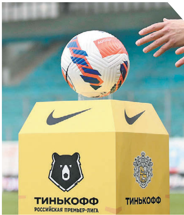
Дарья Исаева «СЭ». Снято на Canon