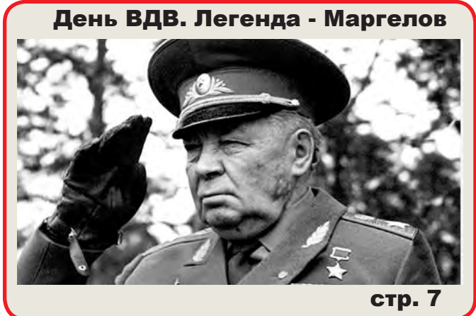
День ВДВ. Легенда - Маргелов