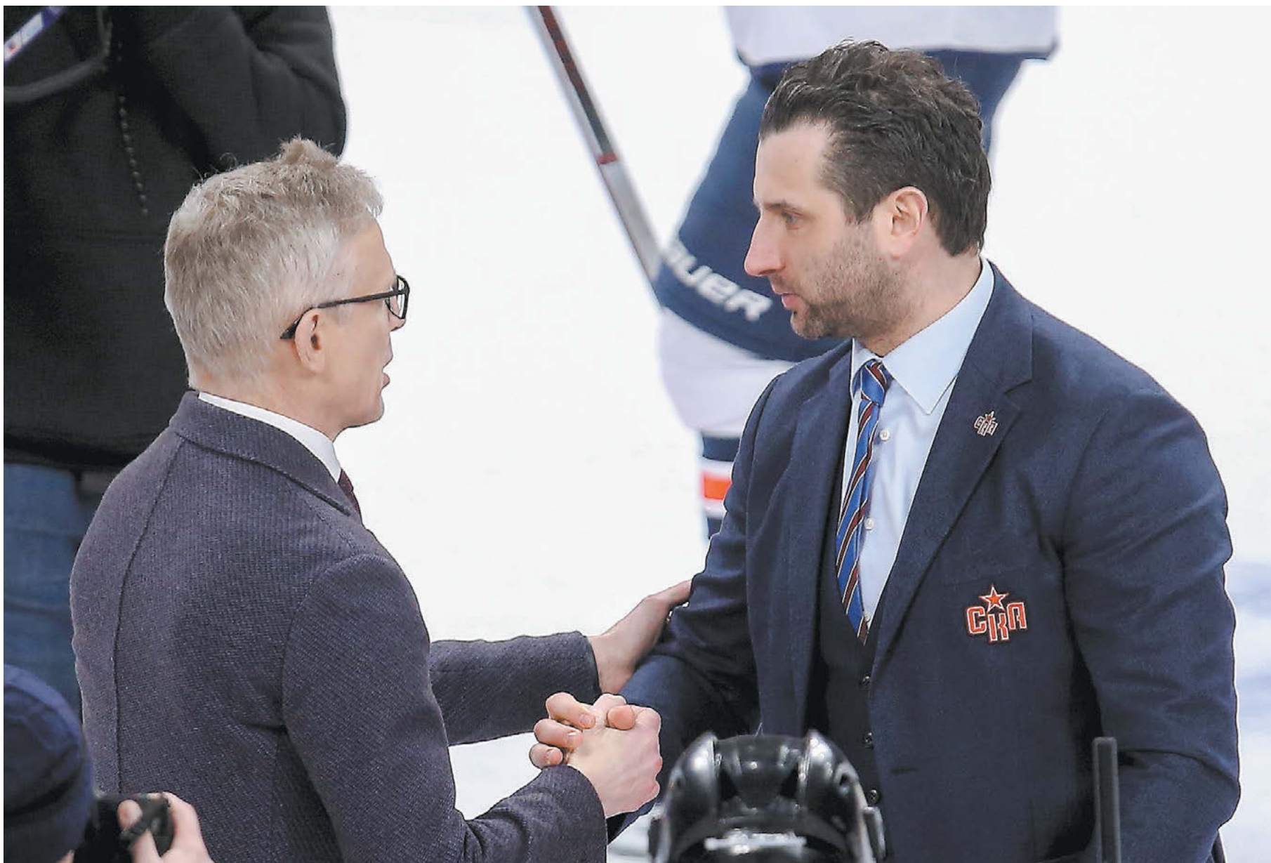
Игорь Ларионов и Роман Ротенберг