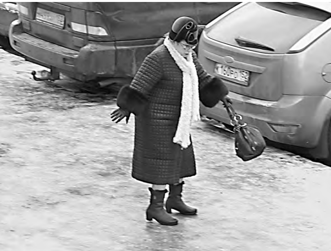
Риск упасть и получить травму велик даже в самом центре города.