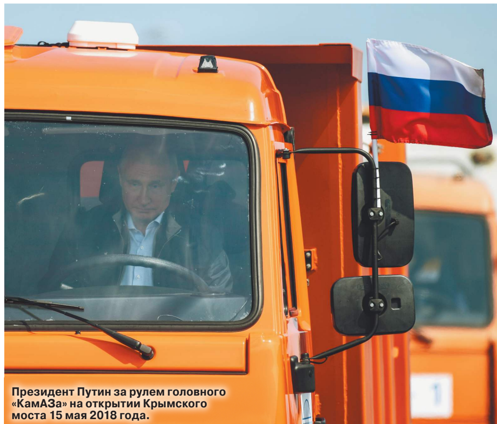
Президент Путин за рулем головного «КамАЗа» на открытии Крымского моста 15 мая 2018 года.

Академик РАН Александр Дынкин: «К концу столетия во всех крупных странах численность населения будет значительно ниже, чем сейчас»