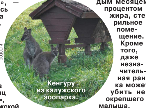
Кенгуру из калужского зоопарка.