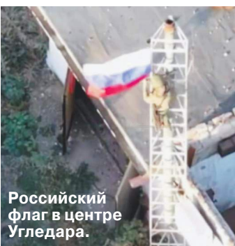
Российский флаг в центре Угледара.