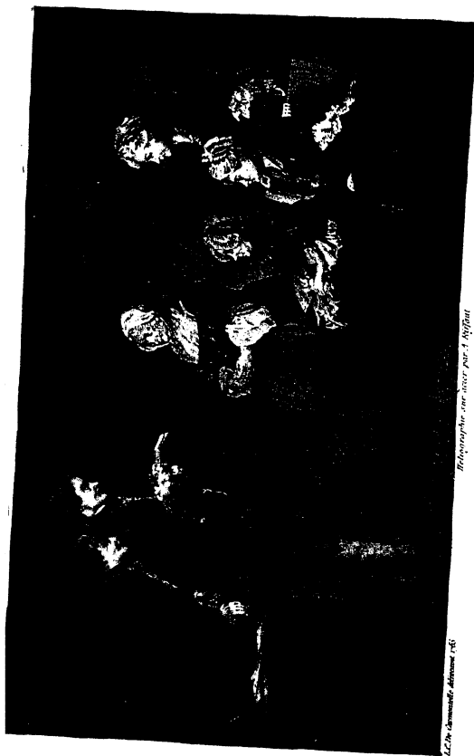
h.c. De chemische definitie rfi