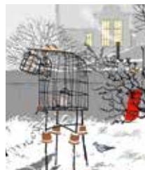
Рисунок на обложке: © Jan Bowman, UK