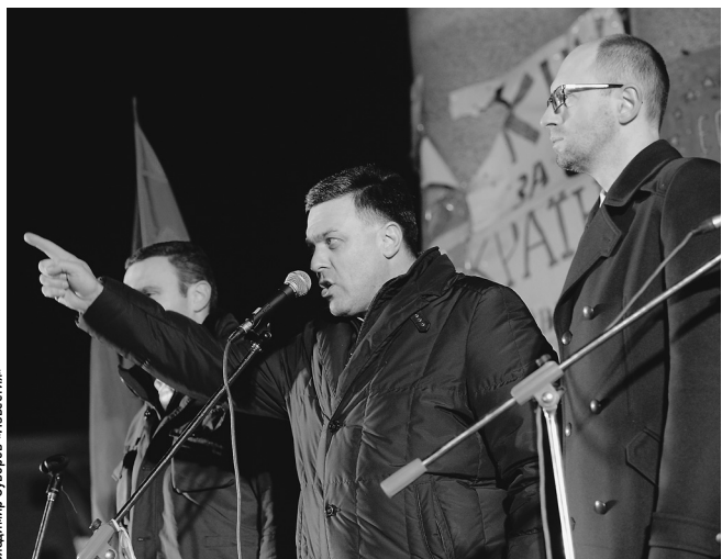
ВЛАДИМИР СУХАРЕV: ФАКСТАЙМ

— Я направляю на имя министра иностранных дел России