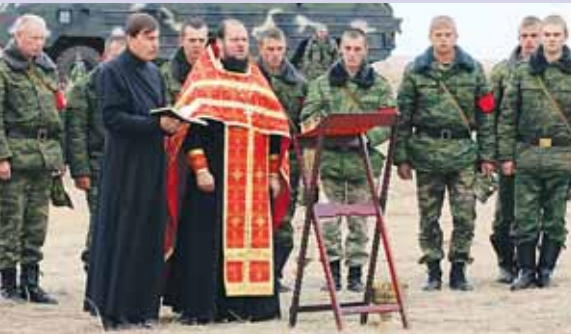
По сообщениям корреспондентов «ВПК», информгентство АРМС-ТАСС и Интерфакс-АВН

По данным исследований и опросов Социологического центра Вооруженных Сил РФ, сегодня более 70% военнослужащих армии и флота считают себя верующими. Из них около 80% верующих относят себя к православным христианам, около 13% — к мусульманам, около 3% — к буддистам, 4% — к приверженцам иных верований. На территории частей Минобороны сейчас действует 530 храмов.