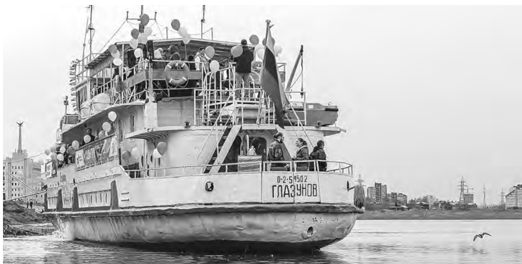
ДЕПАРТАМЕНТ ЗДРАВООХРАНЕНИЯ ТОМСКОЙ ОБЛАСТИ