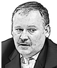
Константин Затулин политик

Вероятно, что-то за это время и можно изменить, решить