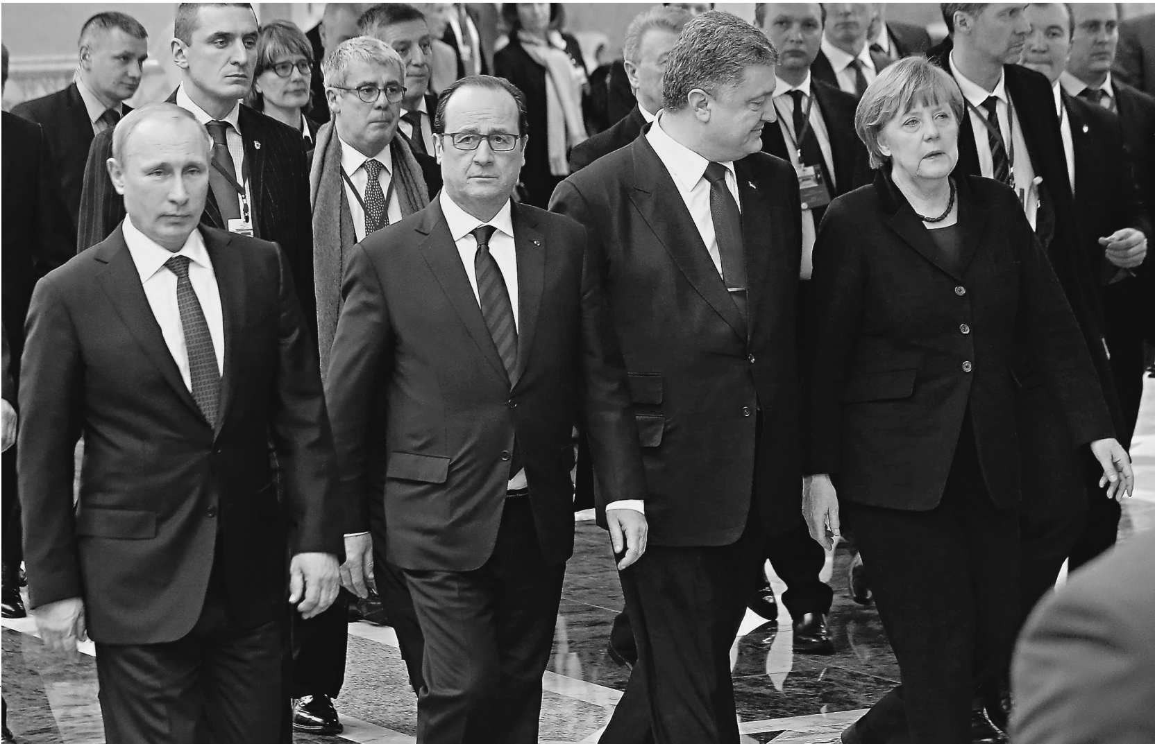
Обсуждение украинских проблем было долгим, но результативным