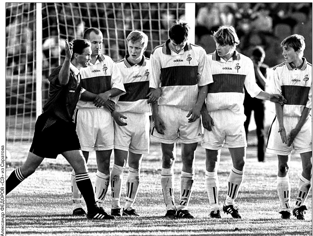
Вчера. Саратов. Стадион «Локомотив». «Сокол» - «Факел» - 1:0. Главным действующим лицом матча оказался петербургский арбитр Сергей КУЗНЕЦОВ.