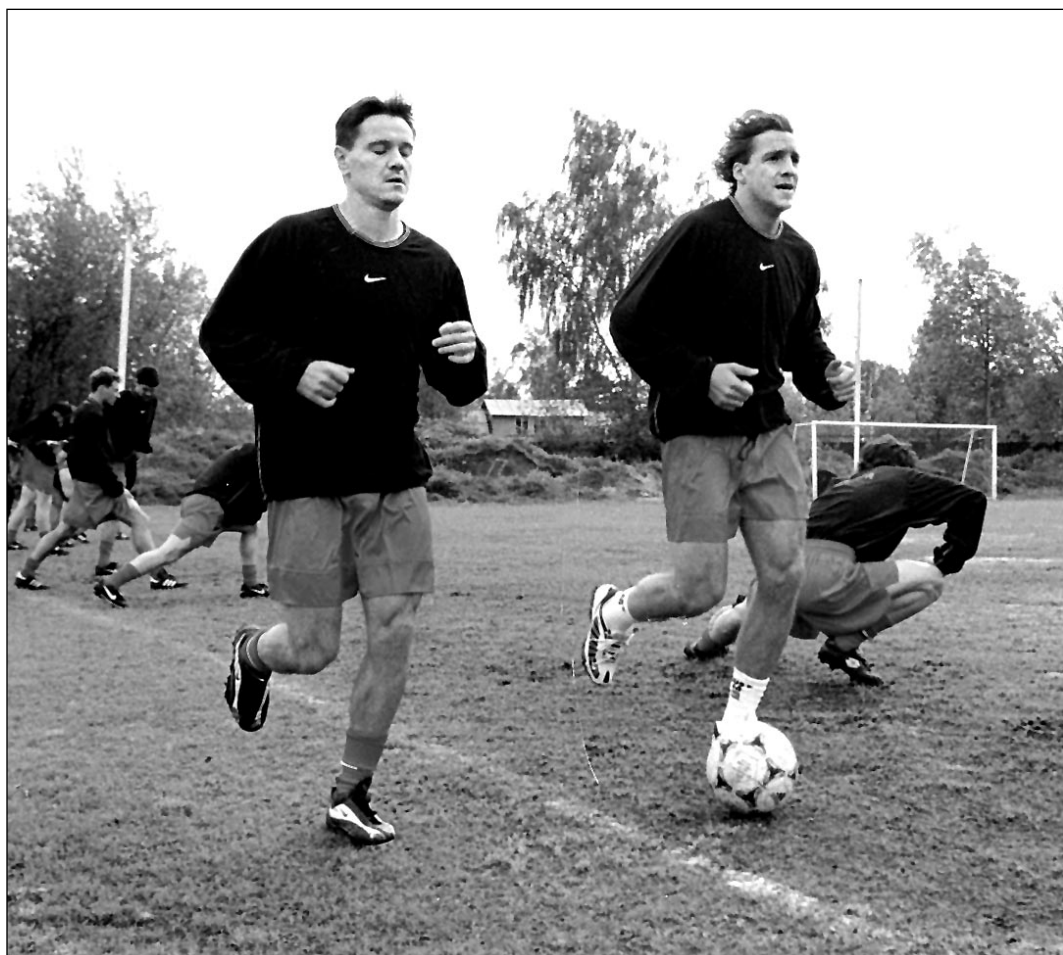
Вчера. Тарасовка. Дмитрий АЛЕНИЧЕВ (слева) и Сергей ЮРАН на вечерней тренировке сборной России.

За «зеленых» играли Станислав Черчесов, Игорь Яновский, Игорь Чугайнов, Юрий Дроздов, Дмитрий Хлестов, Александр Широко и Андрей Тихонов. Им противостояли «оранжевые» - Александр Филимонов, Виктор Онопко, Артур Пагаев, Алексей Смертин, Сергей Семак, Александр Панов, Егор Титов и Дмитрий Хохлов. Кста-ти, Хохлов приехал в Тарасовку сразу по окончании первенства Голландии и поддерживал форму, тренируясь со «Спартак».