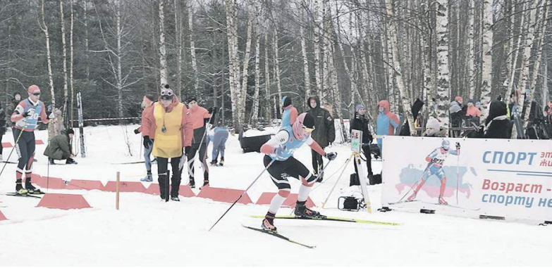
Лучшие лыжники – в Военной академии ВКО.

Завершился чемпионат МВО по лыжным гонкам