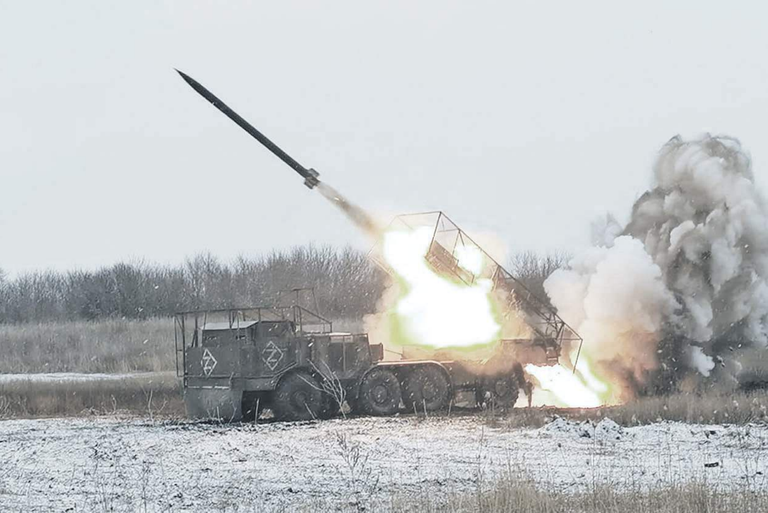
Вражеский укреп накрыл «Ураган»...

Реактивно-артиллерийский дивизион бьёт врага под присмотром своего талисмана – ручной совы Сявы