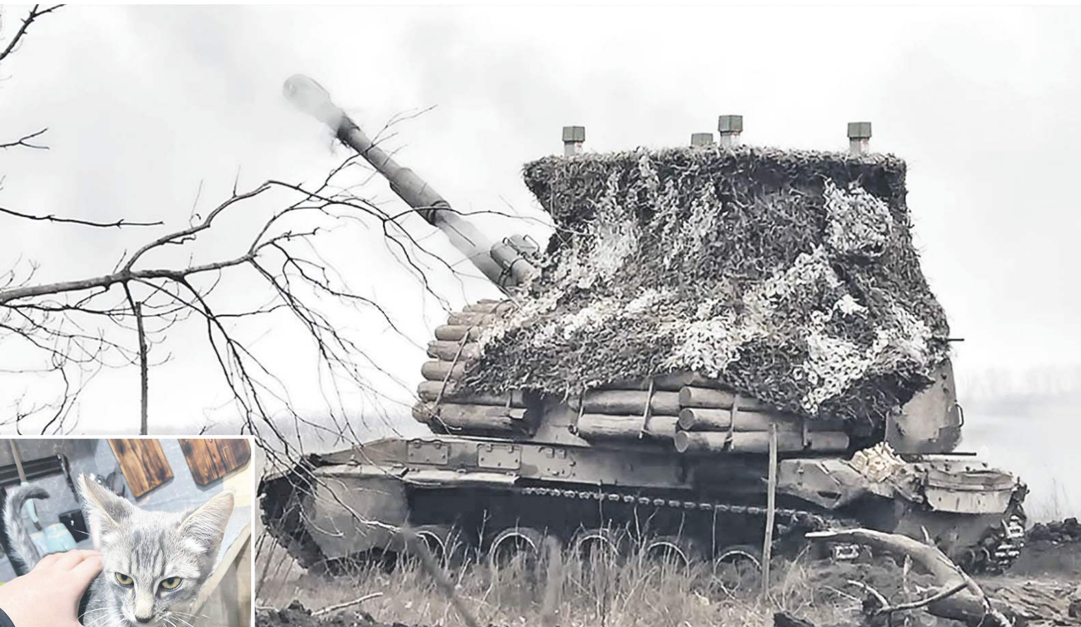
Гаубичный самоходно-артиллерийский дивизион – дальнобойность «Мсты» и зверский аппетит кота Шустрого.

Процент попадания у этого управляемого снаряда повышенной точности – сто из ста