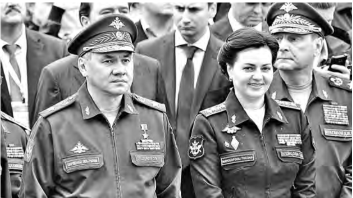
Погоны за годы работы стали другого образца. Фронт работ — расширился.

содержание армии. Более 55 про- центов бюджета Минобороны уходит на финансирование Го- сударственной программы вооружений. И лишь менее половины — собст- венно на нужды вооруженных сил: боевую подготовку, об-