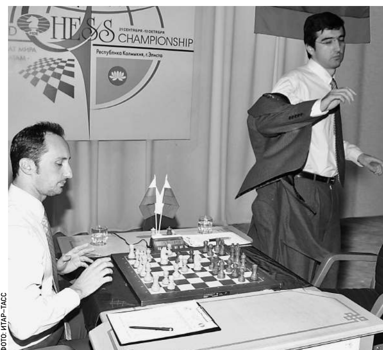
В ходе матча в Элисте Владимир Крамник (справа) покинул сцену гораздо чаще своего соперника