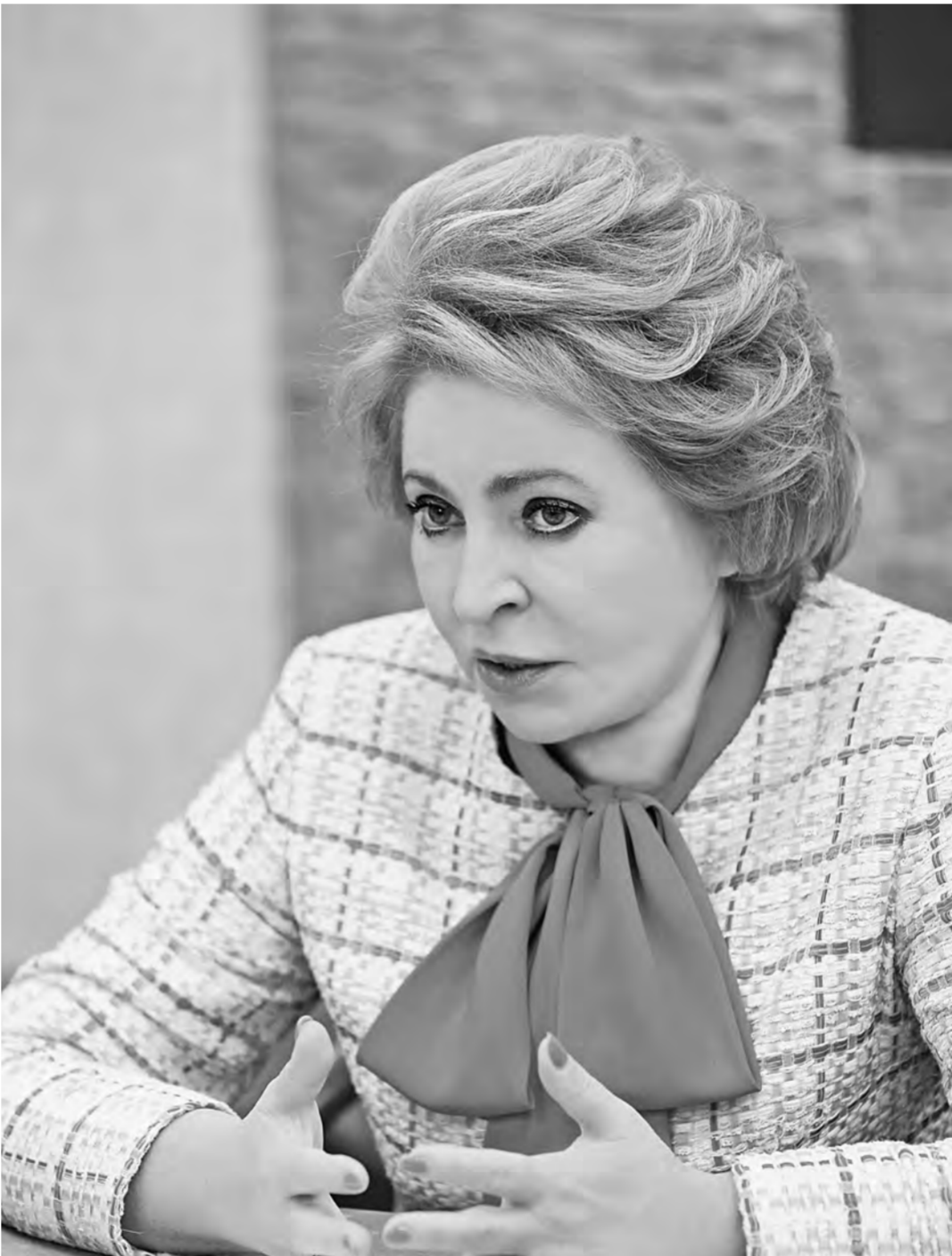
Валентина Матвиенко: Убедительная победа «Единой России» отражает реальное настроение общества.