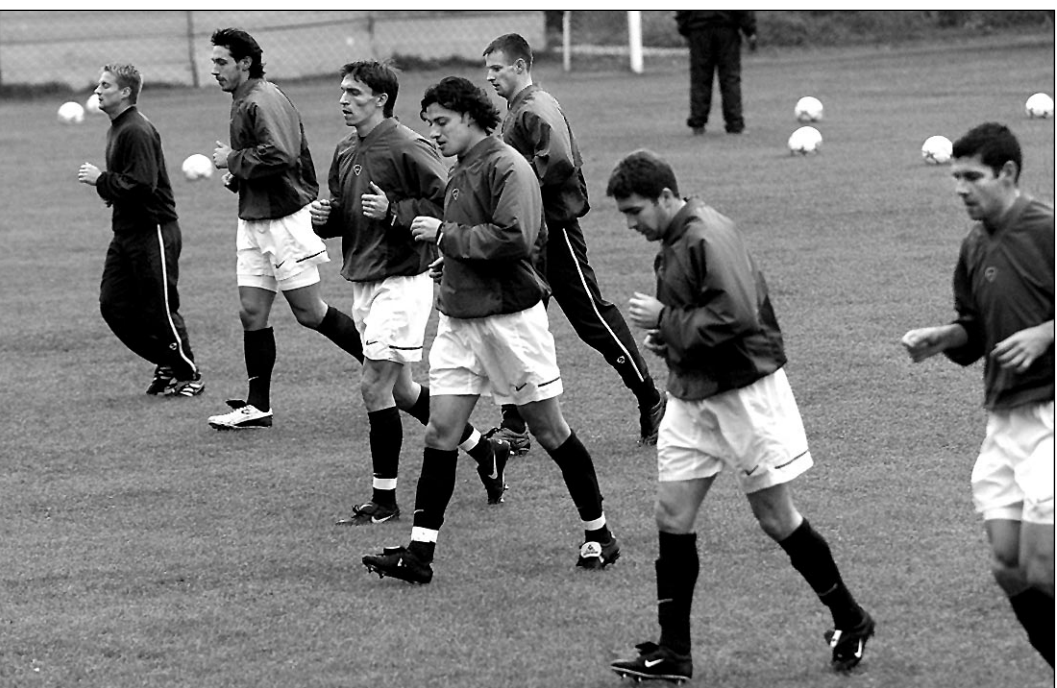
Вчера. Бор. Тренировка сборной России. Почти все отборочный турнир ЧМ-2002 наши футболисты прошли уверенно. Остался последний шаг.

Но в ближайшую субботу, наверное, нет смысла искать ответ на этот вопрос. На субботу задача сформулирована предельно просто - выиграть. И если команда ее выполнит, наверное, Романцев скинет те несколько лет, на которые он постарел, когда два года назад после гола Шевченко, не дожидаясь конца матча, шел от скамейки запасных к выходу со стадиона.