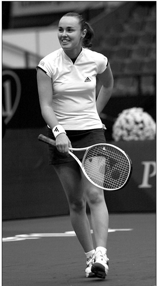
...а Мартина ХИНГИС - уже в четвертьфинал «Кубка Кремля»-2001.