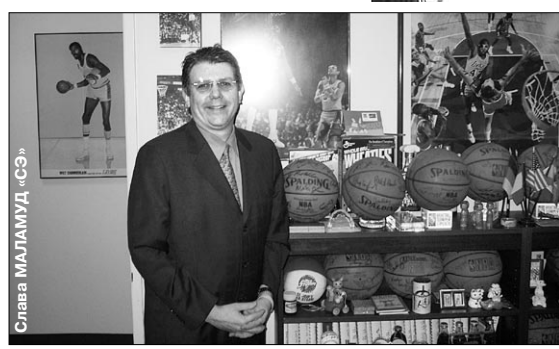
Вице-президент НБА Терри ЛАЙОНС рад визиту российского журналиста в штаб-квартиру НБА, которая находится в одном из самых «крутых» небоскребов Нью-Йорка.

Ответы на эти и на другие вопросы - стр. 8