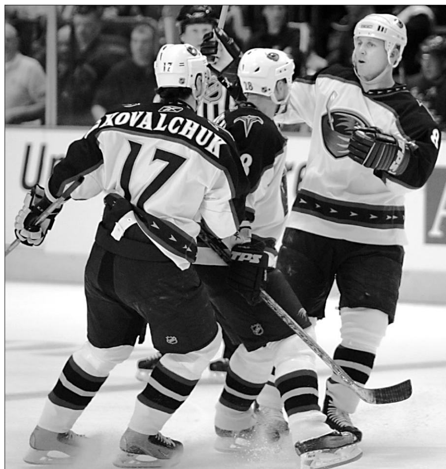
Вчера. Нью-Йорк. «Мэдисон Сквер Гарден». «Рейнджерс» - «Атланта» - 4:2. Илья КОВАЛЬЧУК (№17) и Никлас ХАВЕЛИД поздравляют автора первого гола «Атланты» Кейта ТКАЧУКА (справа).

Проиграв вчера в четвертом матче серии с «Рейнджерс», «Атланта» Илья Ковальчука выбыла из плей-офф. Российский снайпер после игры в раздевалке «Трэшерз» выглядел подавленным и уставшим, но тем не менее подтвердил свое желание помочь сборной России на чемпионате мира в Москве, заметив при этом, что в последние дни никаких контактов с тренерским штабом национальной команды у него не было.