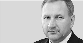
Владимир Сидоров, министр сельского хозяйства и продовольствия Мордовии