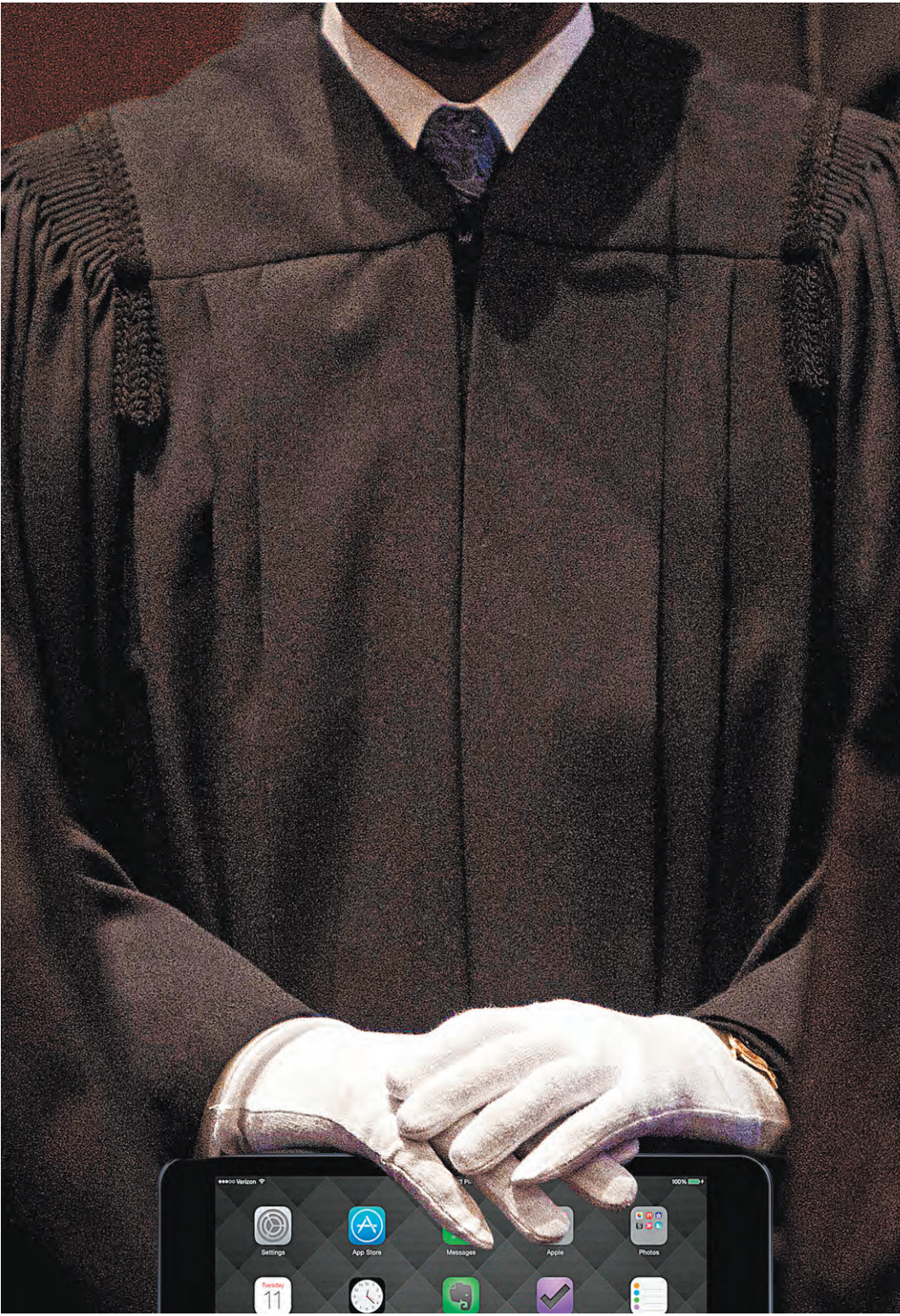
Судьям при общении в соцсетях предстоит серьезно взвесить, кого записывать в друзья.