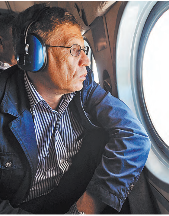
ВЛАДИМИР ПУТИН