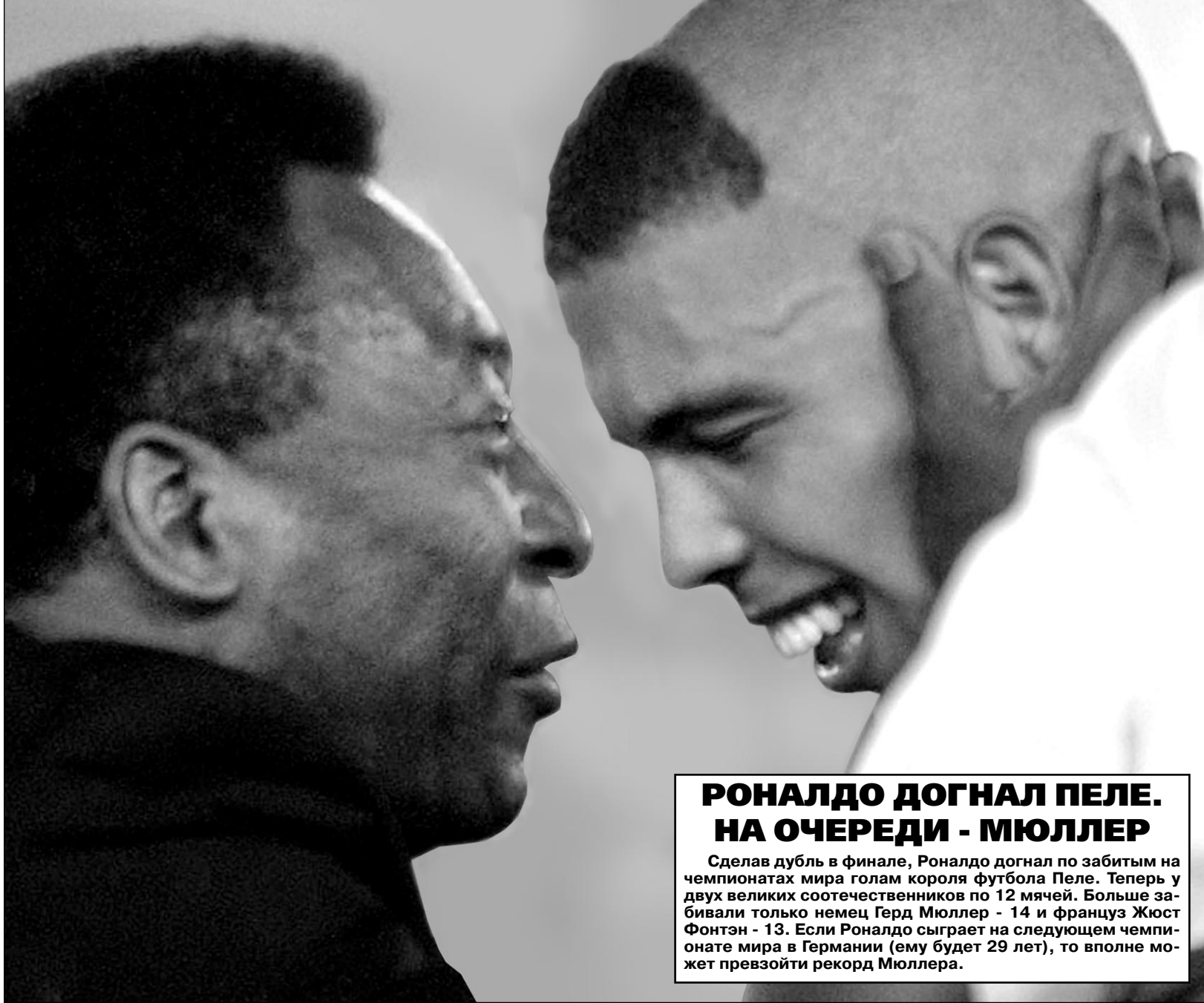
Вчера. Йокогама. Кто плачет - ПЕЛЕ или РОНАЛДО? Плачет вся Бразилия, страна пятикратных чемпионов мира. Поди теперь докажи, что футбол избороли англичане. И кому нужны эти доказательства, кроме самих англичан?

Матч № 64. Финал ГЕРМАНИЯ - БРАЗИЛИЯ - 0:2 (0:0) Гол: РОНАЛДО, 67 (0:1), РОНАЛДО, 79 (0:2).