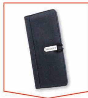
Дорожное портмоне для документов, банковских карт и билетов