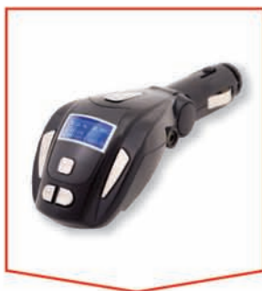
FM-модулятор для автомобиля

В этой книге гуру менеджмента Том Питерс обобщает опыт своих всемирно известных семинаров по инновационному управлению. На сегодняшний день семинары Питерса посетили 3 000 000 человек по всему миру