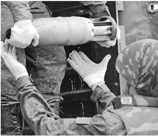
Опасный груз уйдет с полигонов на предприятия

— Большое количество боеприпасов хранится в ненадлежащем виде: нарушена упаковка, ящики гниют. И хотя нельзя не отметить усилий, которые предпринимает новый министр обороны, в ближайшие 1–1,5 года риски чрезвычайных ситуаций будут существовать, и Минобороны этого не скрывает, — отметил в интервью «Известиям» зампред думского комитета по