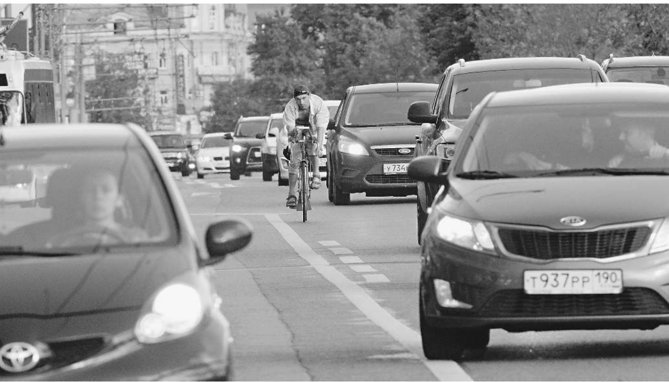
Сами велосипедисты не всегда принимают во внимание остальных участников движения