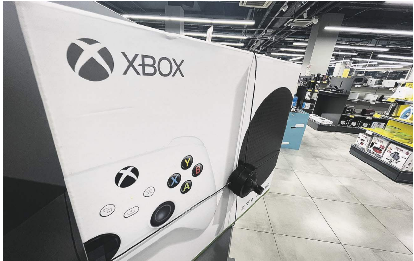
Павел Воронин / Известия