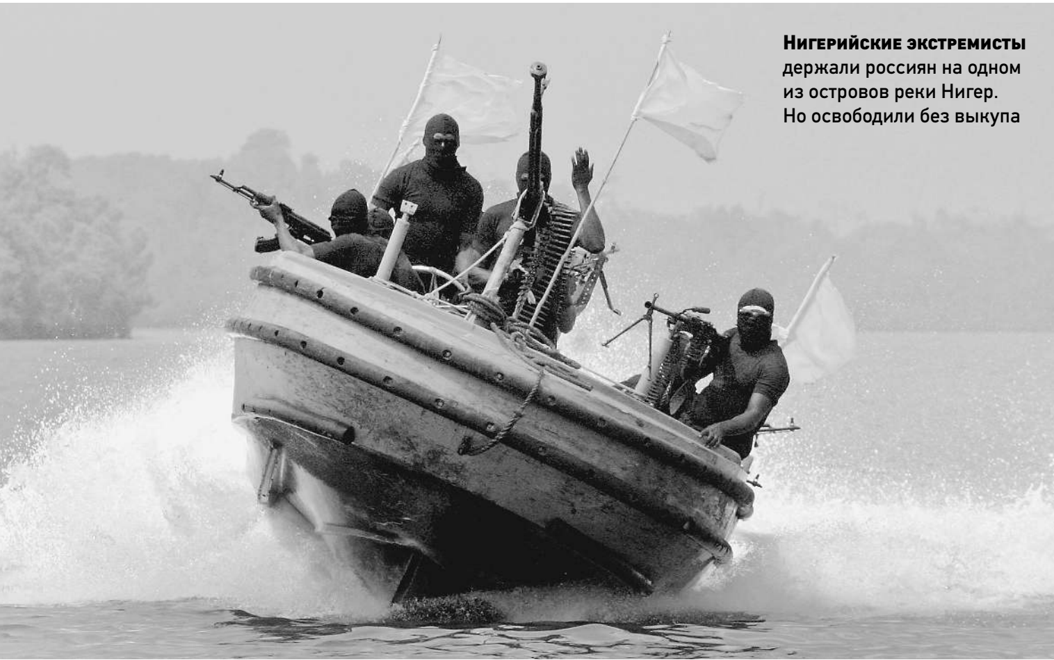
НИГЕРИЙСКИЕ ЭКСТРЕМИСТЫ держали россиян на одном из островов реки Нигер. Но освободили без выкупа

«Они очень устали. Сразу бросились есть, а потом заснули»