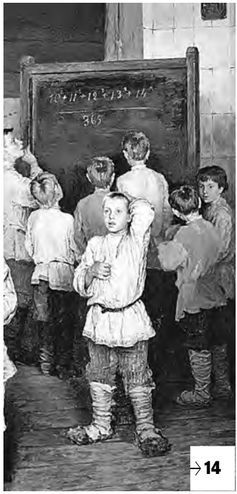
Фрагмент картины художника И.П. Боданова-Бельского «Устный счет».

Простое задание для 5-го класса на ЕГЭ по математике не смогли выполнить 150 тысяч выпускников российских школ