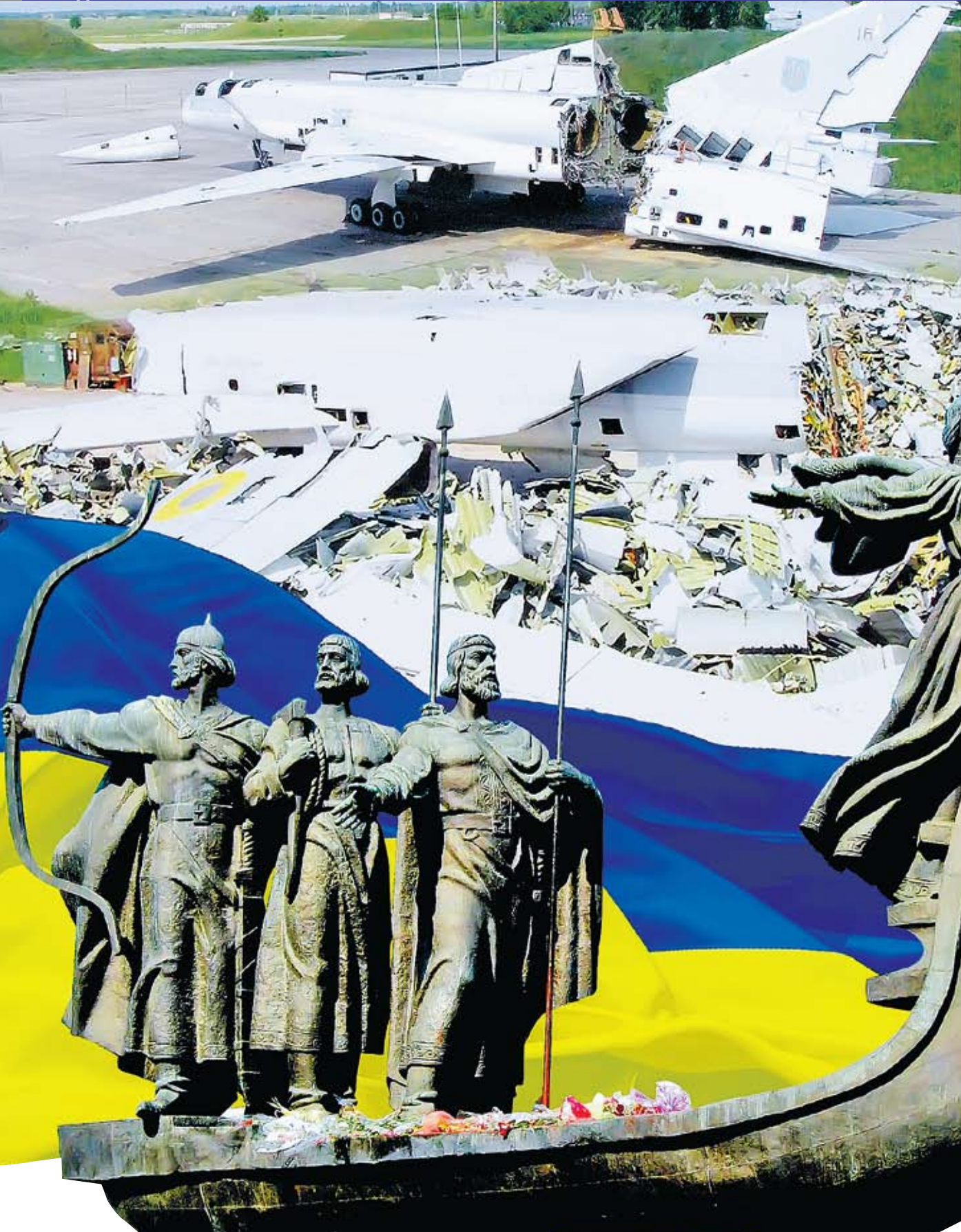
Коллаж Андрей СЕДЫХ

явилась результатом интереса одного из государств Ближнего Востока к этому оружию. Можно согласиться с тем, что ограниченные денежные средства не позволяют рассчитывать на массовое перевооружение украинской армии современной техникой. Вместе с тем экс-министр обороны Украины Александр Кузьмук заметил в свое время, что сейчас нужно создать необходимый научный и конструкторский задел образов вооружения будущего поколения, которые украинские сухопутные войска, ВВС и ВМС смогут получить по мере улучшения дел в экономике страны.