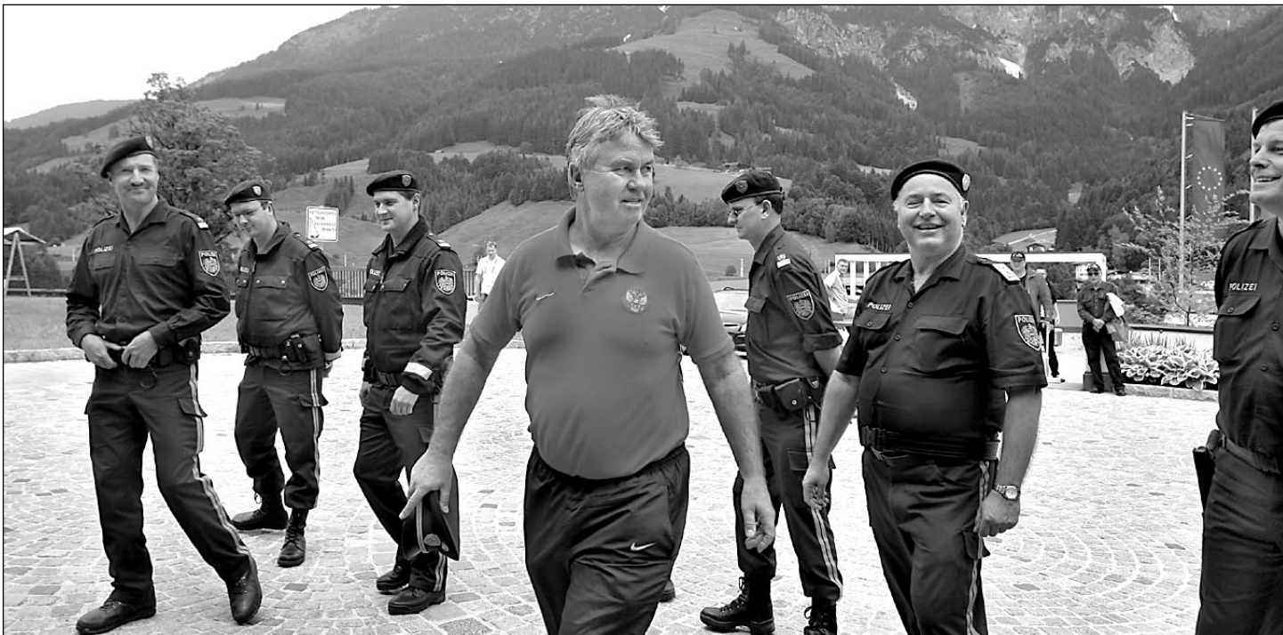
Вчера. Леоганг. Гус ХИДДИНК.

- И это не так уж плохо. Когда футболисты подсознательно думают о ничейном исходе, это может завершиться для них плачевно. Можно сказать, в Инсбруке начнется плей-офф для нашей команды.