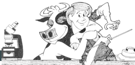
Размножение племенного скота — в руках человека