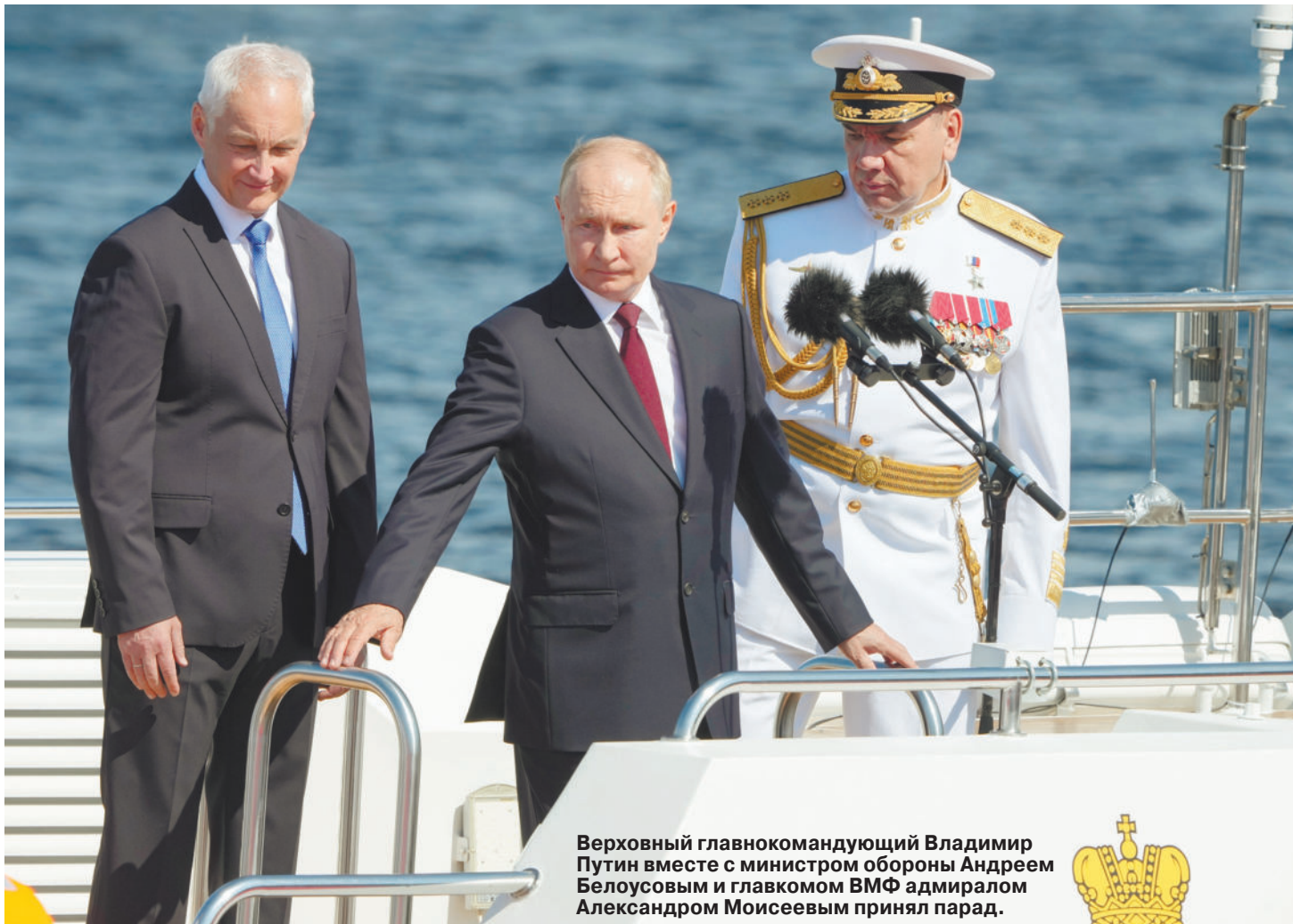
Верховный главнокомандующий Владимир Путин вместе с министром обороны Андреем Белоусовым и главнокомандующим ВМФ адмиралом Александром Моисеевым принял парад.

Президент принял парад в честь Дня ВМФ в акватории Невы