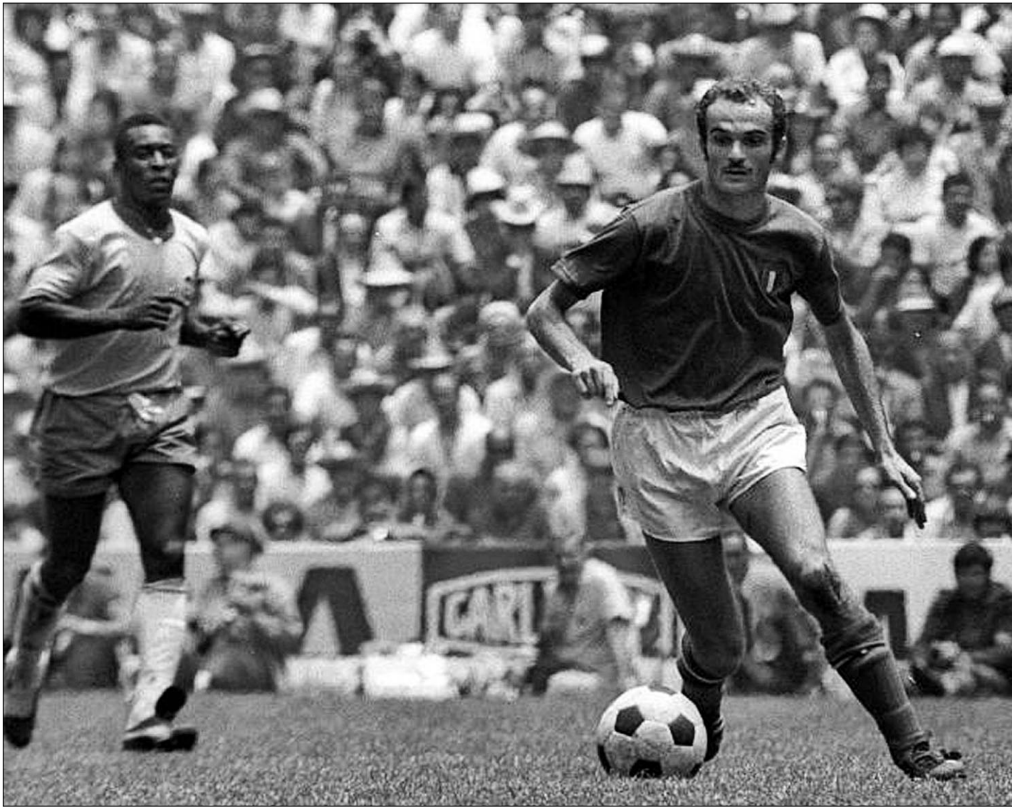
21 июня 1970 года. Мехико. Финал ЧМ-70. Бразилия - Италия - 4:1. Сандро МАЦЦОЛА и великий ПЕЛЕ.

Когда мы играли против великолепной сборной СССР, мне приходилось иметь дело как раз с Шестерневым, и его фамилию и запомнил на всю оставшуюся жизнь. Да и вообще советская сборная моего поколения была одной из