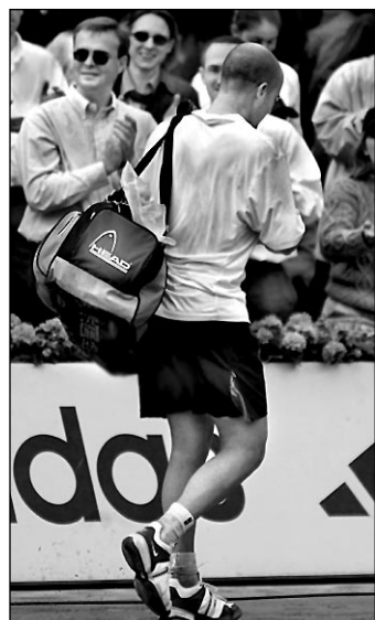
Вчера. Париж. Стоило экс-президенту США Биллу КЛИНТОНУ появиться на трибуне, удача от Андре АГАССИ отворачивалась...