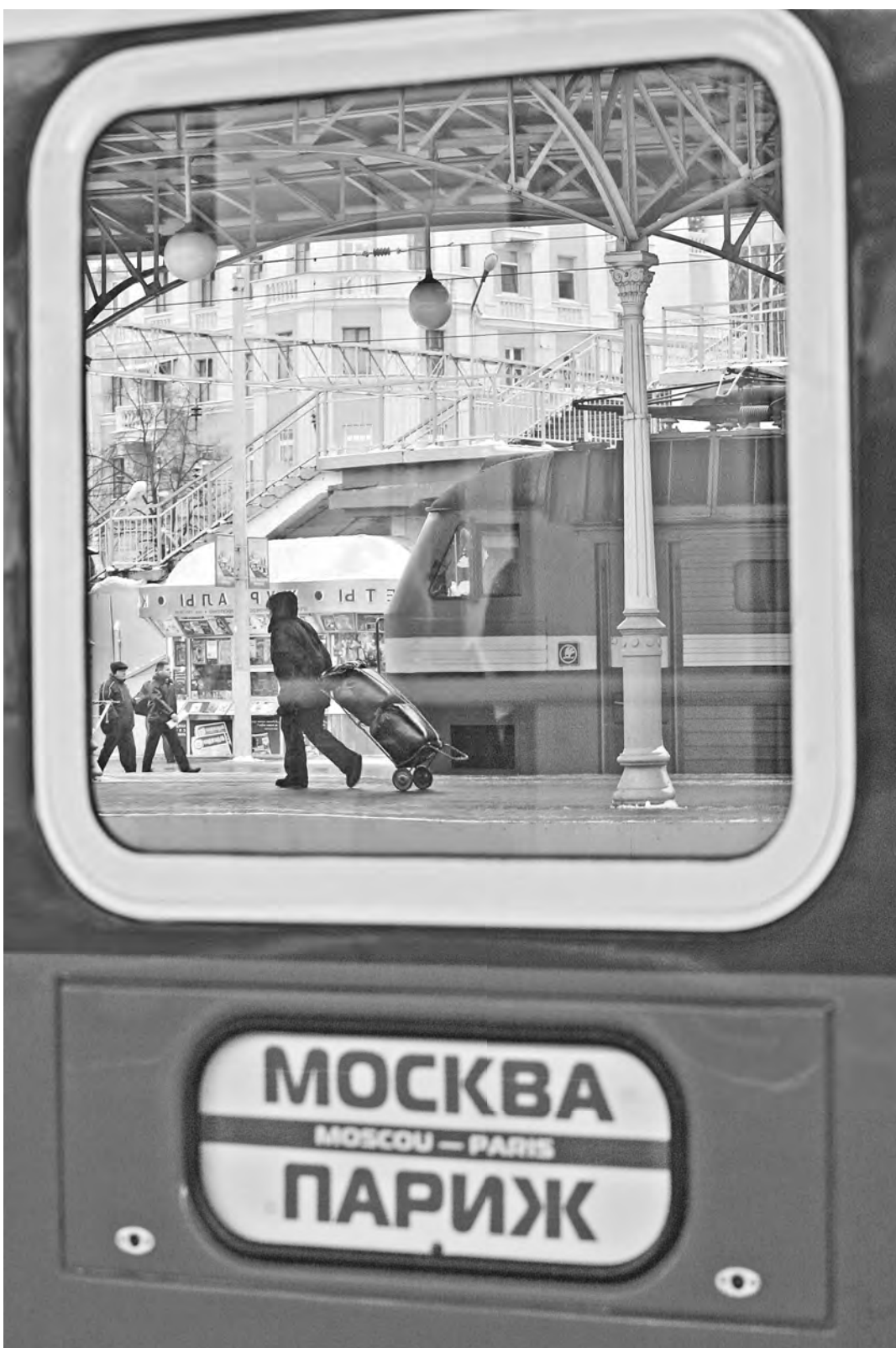
Санкции работают по принципу курсирующего туда-сюда поезда, привозя неудобства как и для российской, так и для европейской экономики.

ПРОЕКТ Нелегальным таксистам грозят штрафами в 30 тысяч рублей