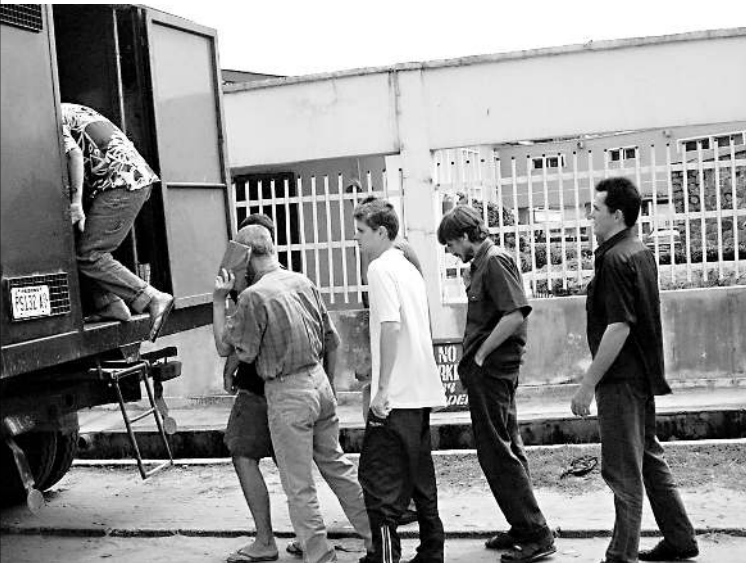
Российские моряки танкера African Pride — по пути из нигерийского суда в нигерийскую тюрьму

Но 12 новороссийцев к спецслужбам отношения не имеют. Летом 2003 года они при посредничестве одной из криминологических (занимающихся набором морского персонала) компаний заключили контракт с греческой компанией Azure Services Inc и нанялись на танкер African Pride («Гордость Африки»), ходящий под панамским флагом. 8 октября 2003 года по распоряжению почти все махнули рукой на пленников. Российские власти в упор не замечали пробле-