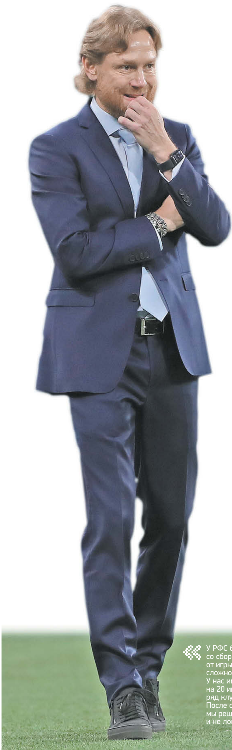
Главный тренер сборной России Валерий Карпин